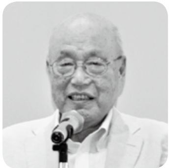
判野本部幹事長挨拶