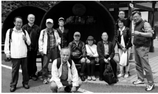
集合写真(浜福鶴にて)

お次は、「白鶴酒造記念館」。こゝは、浜福鶴で散々飲んだので、軽く済ませました。お昼は、石屋川公園で、持ち