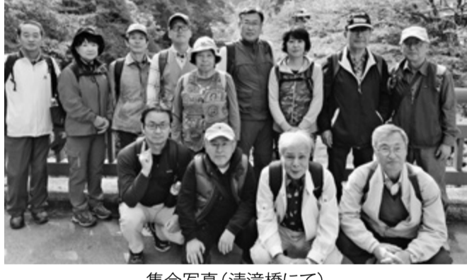
集合写真(清滝橋にて)