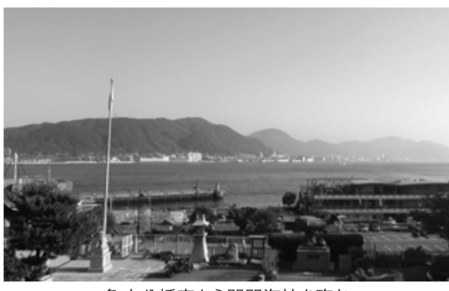
亀山八幡宮から関門海峡を臨む