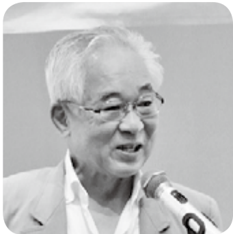
木下同窓会会長挨拶