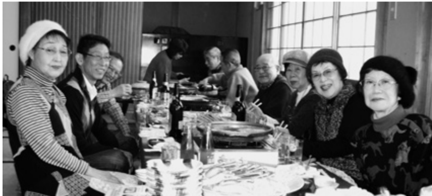
開始前の穏やかな様子

さあー出発、特急に乗り込んだ時から、至れり尽くせりの大パーティー開始です。段取りは我々幹事にお任せあれ。赤ワイン、白ワインやビールに大吟醸すべて飲み放題。ツマミは、あたりめ・おか