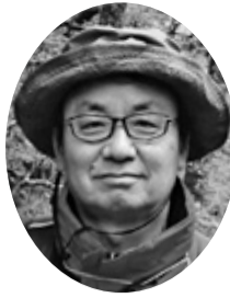
下方 常由 (47期)

皆様、お元気でいらつしやいますか? 「冬はコタツで丸くなるー」って、出不精になっておられませんか?